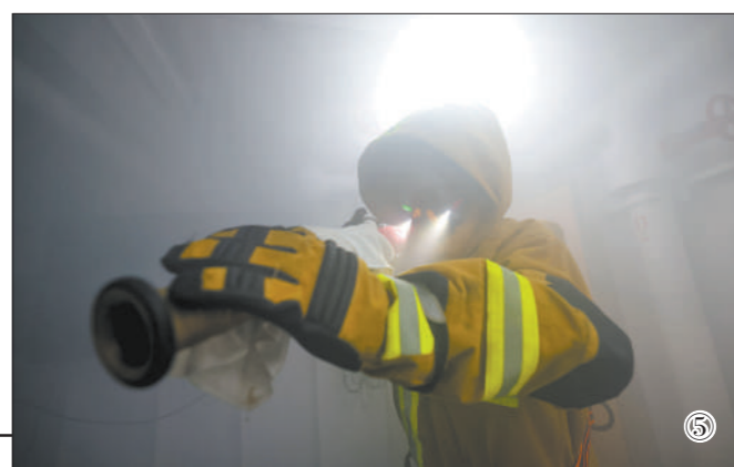
图①：舰艇航行途中。 图②：编队进行纵向补给训练。 图③：解缆起航。 图④：观察搜寻“落水人员”。 图⑤：在浓烟环境进行损害管制训练。