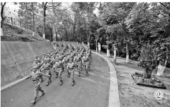
图2：临近春节，某部官兵列队行进在营区间。