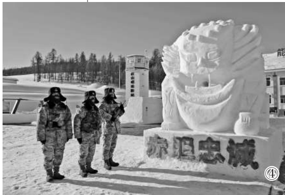
图4：红山嘴哨所营门口，执勤官兵在雪景前坚守。