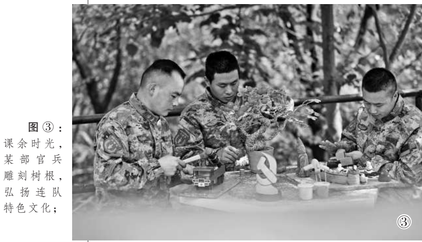
图3：课余时间，某部官兵雕刻树根，弘扬连队特色文化。