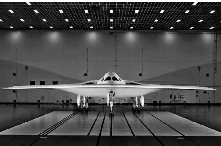
B-21“突袭者”隐形战略轰炸机。

新闻事实：据美国媒体报道，1月22日，美国国防部副部长拉普兰特在一份声明中表示，B-21“突袭者”隐形战略轰炸机项目已进入“低速生产阶段”。五角大楼已与诺思罗普·格鲁曼公司签订相关采购合同。