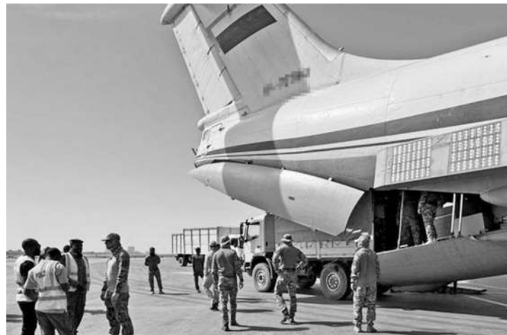
俄军事人员飞抵瓦加杜古后卸载物资。

新闻事实：据路透社报道，1月24日，一支由100人组成的俄罗斯军事特遣队抵达布基纳法索首都瓦加杜古。这支特遣队是俄罗斯“非洲军团”向非洲地区部署的首批部队，后续人数将增加至300人。