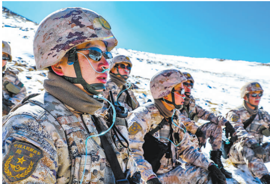
左图：1月上旬，阿里军分区西塔边边防连官兵踏雪巡逻。图为官兵在巡逻途中吸氧休息。

笔者翻阅“建言档案”看到，一条条紧贴部队实际的意见建议直击问题所在，机关科室的答复反馈写在问题下方，已被纳入新年度工作计划的建议标记着特殊符号。该旅领导介绍，为促进计划落地落实，他们依照路线图设计、工程化推进的方法，按照节点倒排时间表、明确责任人、指定监督者，确保各项工作任务有序推进、不挂空挡。