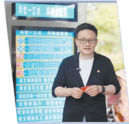
江苏省南京市电视台拍摄优待证使用宣传视频。