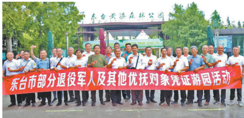
江苏省东台市组织退役军人及其他优抚对象凭证游园活动。

今年1月1日,为方便优抚对象游览,江苏省退役军人事务厅通过新媒体平台向社会发布“新年大礼包”——13