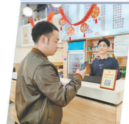
浙江省临海市退役军人扫码支付享优惠。