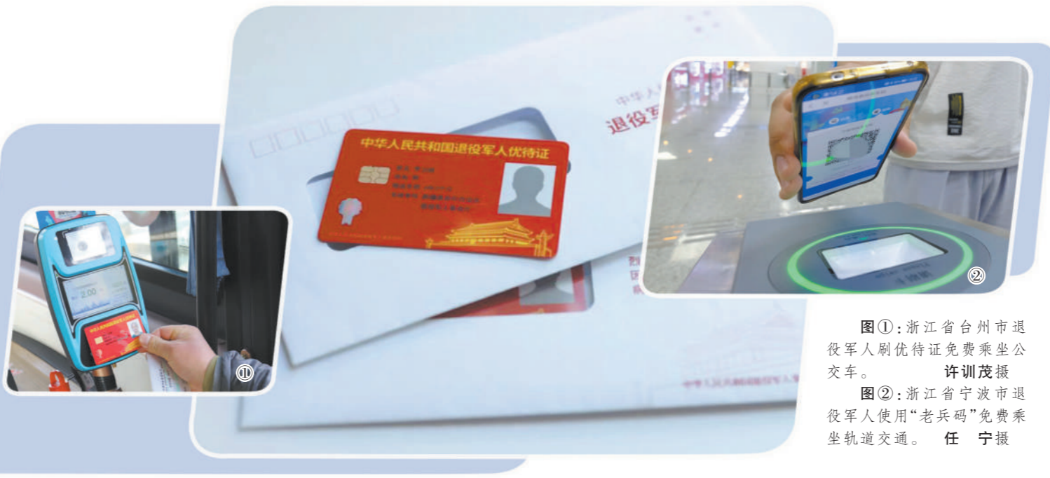
图①:浙江省台州市退役军人刷优待证免费乘坐公交车。