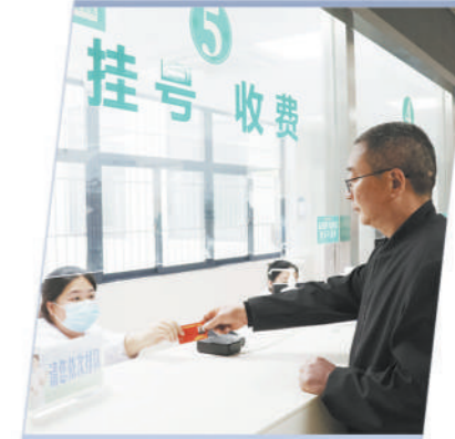
江苏省淮安市退役军人在医院使用优待证。