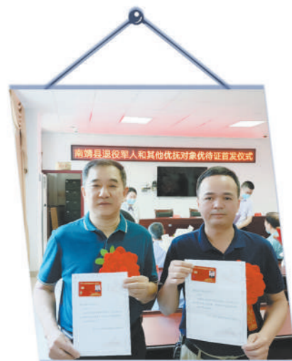
福建省南靖县举行优待证首发仪式。