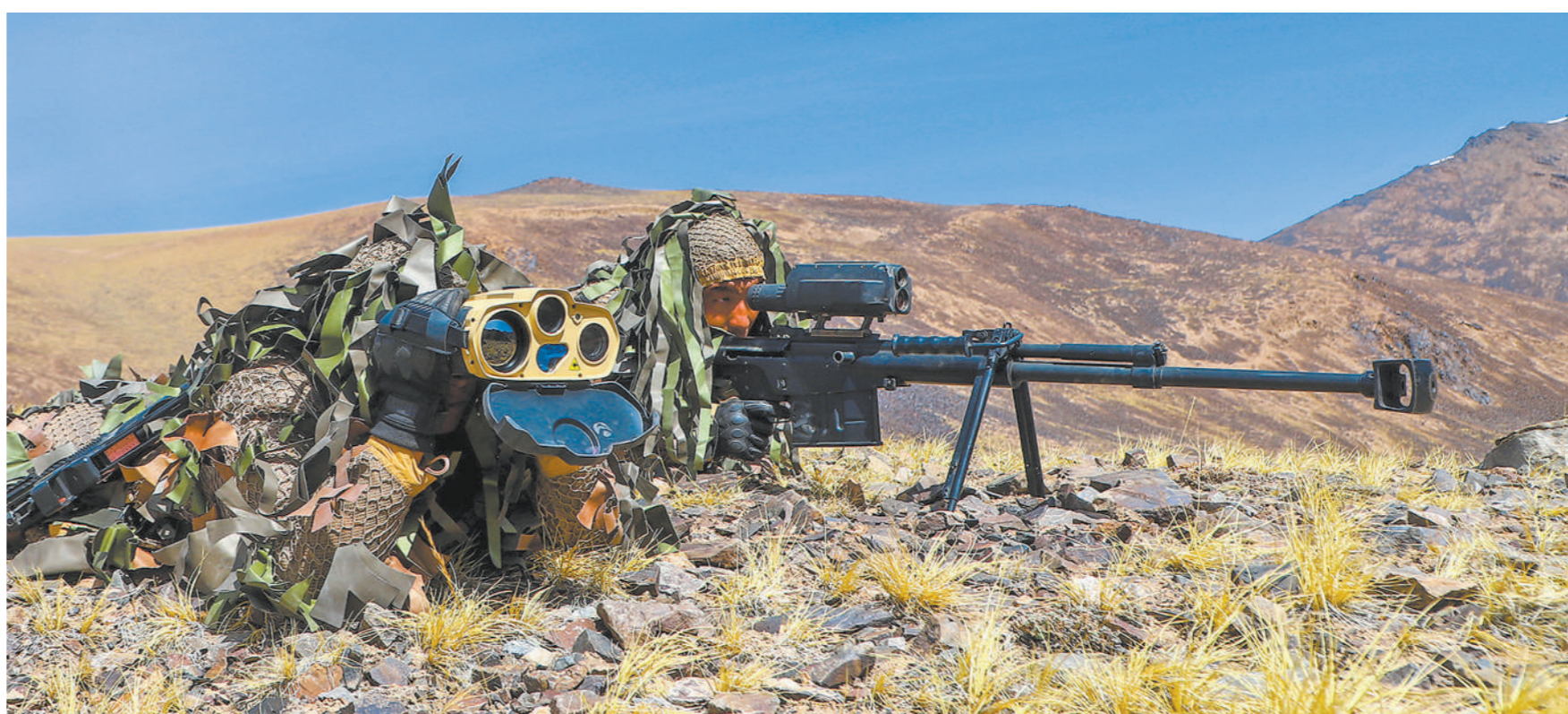
下图：日前，新疆军区某团侦察分队开展实战化训练。