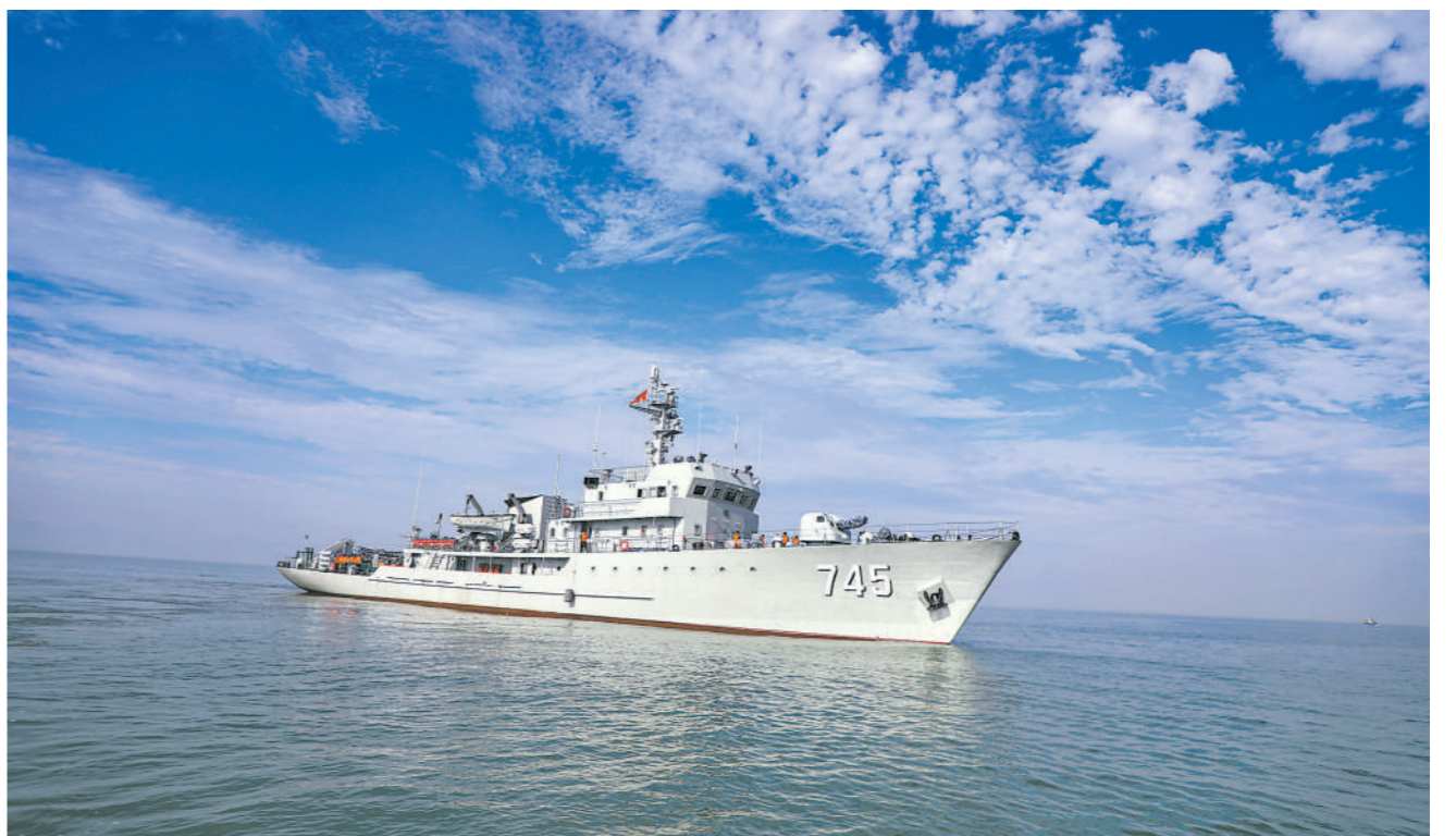
近日,南部战区海军某大队开展实战化训练。

征程万里风正劲,重任千钧再出发。新时代新征程上,面对依然严峻复杂的反腐败斗争形势,军队纪检监察机关和纪检监察干部要认真学习贯彻习主席重要讲话精神和习主席关于党的自我革命的重要思想,全面贯彻落实党的二十大精神关于坚定不移全面从严治党、深入推进新时代党的建设总要求,围绕中心、服务大局,紧盯顽疾精准纠风除弊,贯通融合深化体系治理,推动军队党风廉政建设和反腐败斗争向纵深发展。要以更大决心、勇气和韧劲加强自身建设,自觉接受最严格的约束和监督,在思想上勇于自我革命,在作风上勇于自我革命,在廉洁上勇于自我革命,在严管上勇于自我革命,敢于善于斗争,积极担当作为,狠抓工作落实,为实现建军一百年奋斗目标提供坚强政治保证和纪律支持。