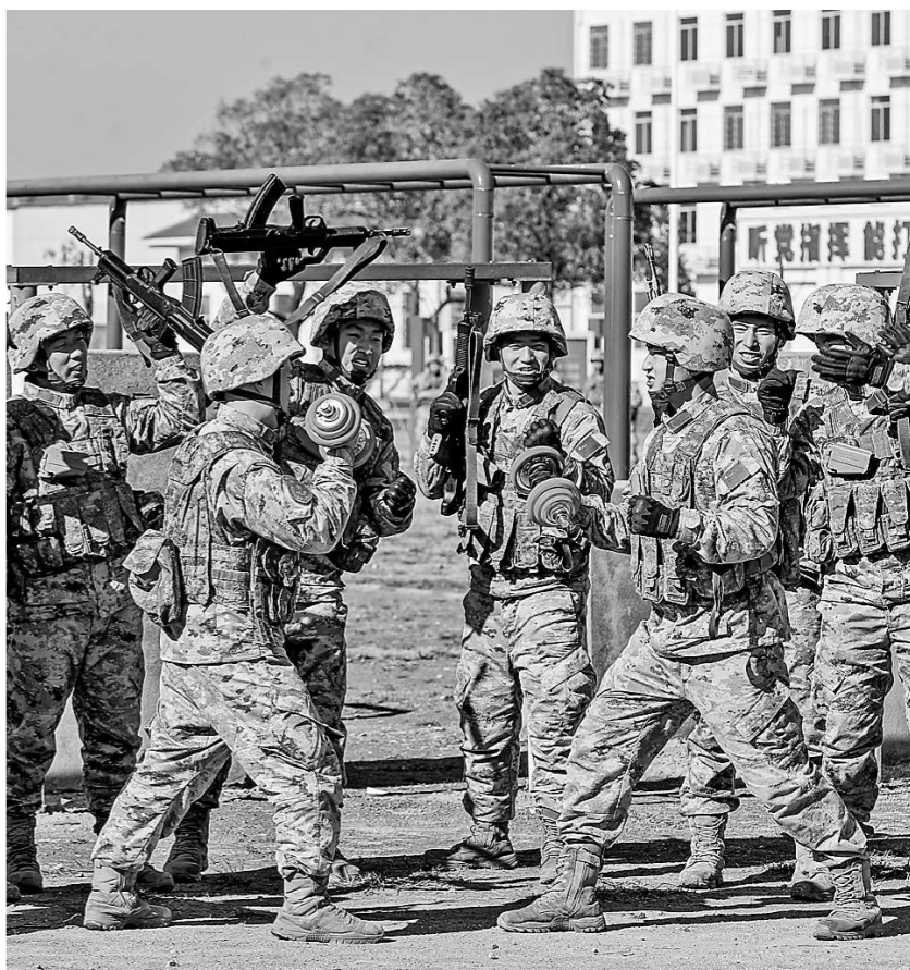
近日，第72集团军某旅利用训练间隙开展小比武、小竞赛，激发官兵参训热情。图为两名战士进行比拼。