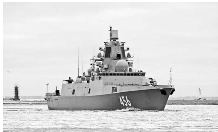
正在进行海试的俄“海军上将戈洛夫科”号护卫舰。

新闻事实:据塔斯社近日报道,去年12月下旬,俄罗斯海军战斗序列中迎来新成员——“海军上将戈洛夫科”号护卫舰。该护卫舰是22350型护卫舰的三号舰,并且是第一艘采用俄罗斯国产动力系统的22350型护卫舰。