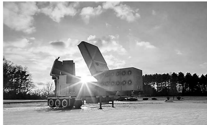
美军“低层防空反导传感器”模型。

新闻事实:据美国防务新闻网1月2日报道,美国陆军要求开发的一款新型雷达将于2024年进行交付测试。该型雷达名为“低层防空反导传感器”,主要用于导弹防御系统,未来将取代目前“爱国者”导弹防御系统中的雷达。