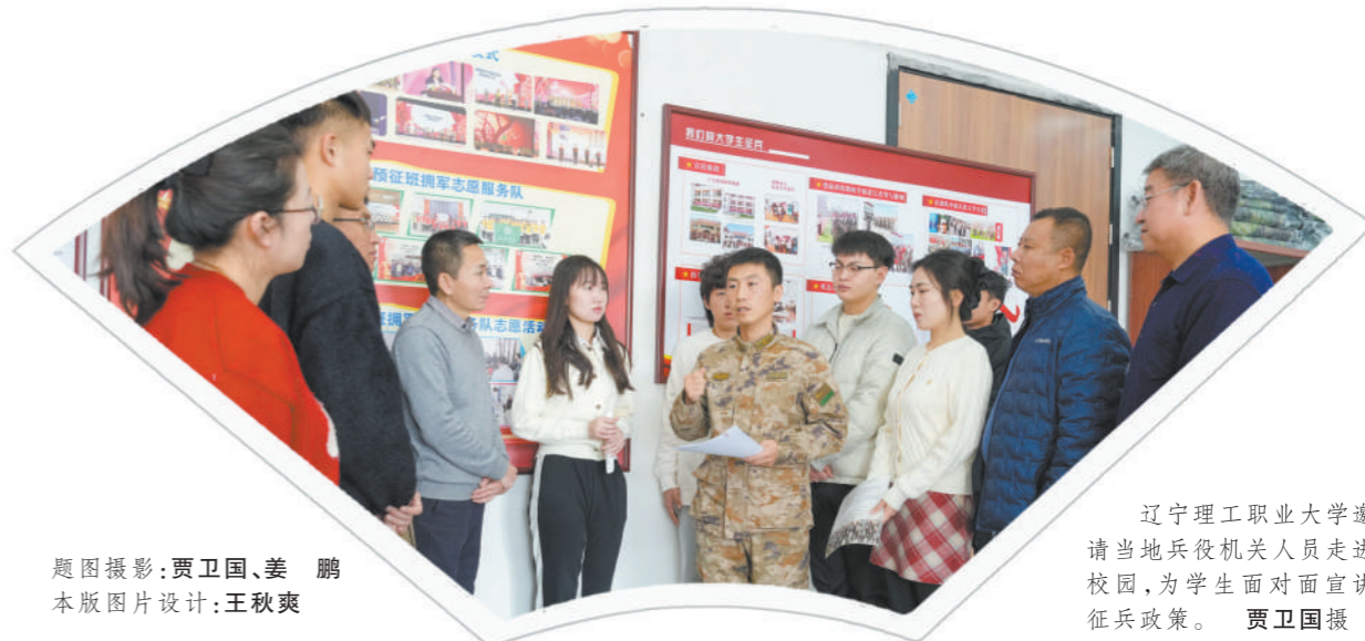
本版图片设计:王秋爽

目前,学校9支拥军志愿者服务队、21个小分队,共有900多名学生参与。像王树宝一样,经常受到大学生拥军志愿者服务的军烈属及老兵约有390多人。