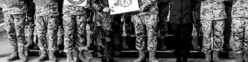
1月1日,河南省平顶山市几位剪纸艺术家走进武警河南总队平顶山支队,为官兵传授剪纸技艺,共庆新年。图为官兵手持“军民鱼水情”等剪纸作品与剪纸艺术家合影。

一次,我奉命参加上级组织的一项任务。环境陌生,条件复杂,精准命中中的难度很大。面对难啃的“硬骨头”,准备期间我和战友整天泡在“数据堆”里,细致汇总、比对、分析近 years 实弹打靶资料,创新使用某攻击方法,反复进行强化训练,将偏差一点点缩小,最终在演习中成功命中目标,并且弹着点误差最小,斩获“金飞镖”奖。