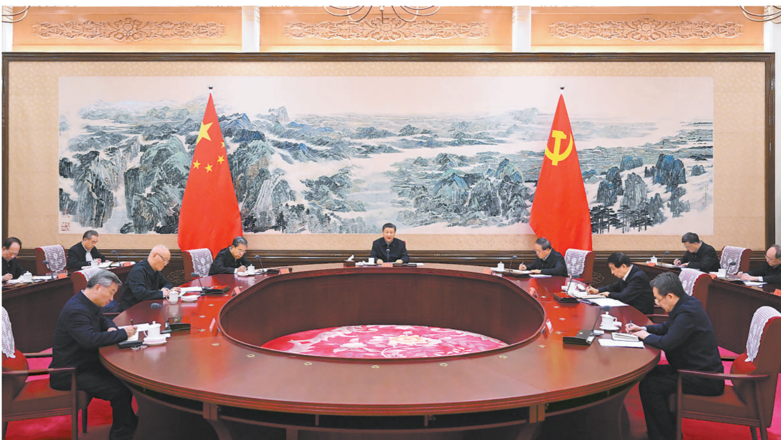
12月21日至22日，中共中央政治局召开学习贯彻习近平新时代中国特色社会主义思想主题教育专题民主生活会，中共中央总书记习近平主持会议并发表重要讲话。

新华社北京12月22日电 中共中央政治局于12月21日至22日召开学习贯彻习近平新时代中国特色社会主义思想主题教育专题民主生活会，聚焦学思想、强党性、重实践、建新功总要求，对照凝心铸魂筑牢根本、锤炼品格强化忠诚、实干担当促进发展、践行宗旨为民造福、廉洁奉公树立新风具体目标，按照以学铸魂、以学增智、以学正风、以学促干重要要求，联系中央政治局工作，联系带头旗帜鲜明讲政治、带头学懂弄通做实习近平新时代中国特色社会主义思想、带头履行全面从严治党责任等方面的实际，总结成绩，查摆不足，进行党性分析，开展批评和自我批评。