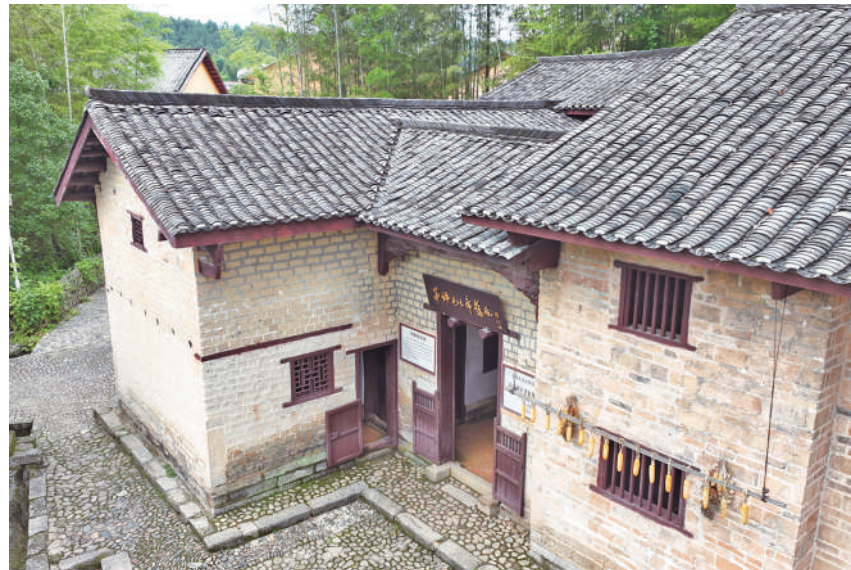
井冈山茅坪八角楼毛泽东同志旧居。

在江西省井冈山市茅坪镇茅坪村谢氏祠堂祠后，有座砖土结构的两层建筑。它就是毛泽东同志居住过的地方——八角楼。1927年，毛泽东同志来到茅坪后，八角楼主人谢氏一家将八角楼上的房间腾给毛泽东同志居住。因房屋顶部的天窗为八角形，得名“八角楼”。