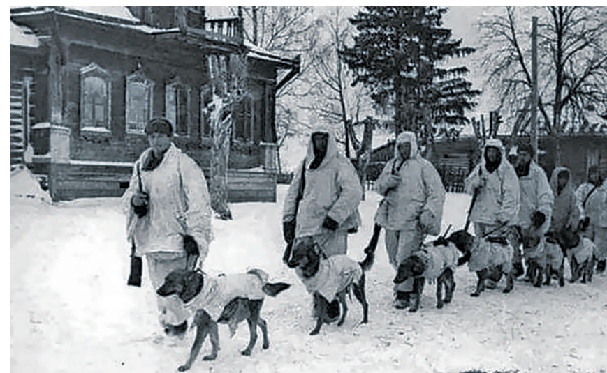
苏联士兵手牵反坦克犬。

1942年后，苏联的军工生产基本恢复，来自盟国的援助也陆续抵达，先前极端缺乏反坦克武器的情况不复存在。反坦克犬不再有用武之地，开始从前线撤回，逐渐消失在人们的视野中。