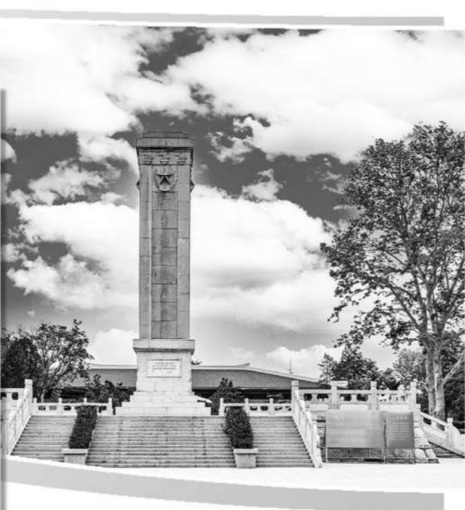
江苏省盐城市革命烈士纪念碑。