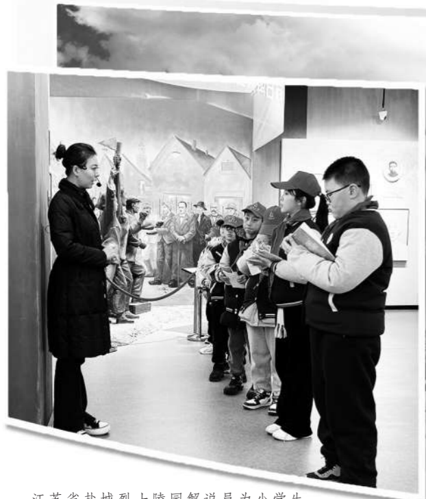
江苏省盐城烈士陵园讲解员为小学生讲述红色故事。