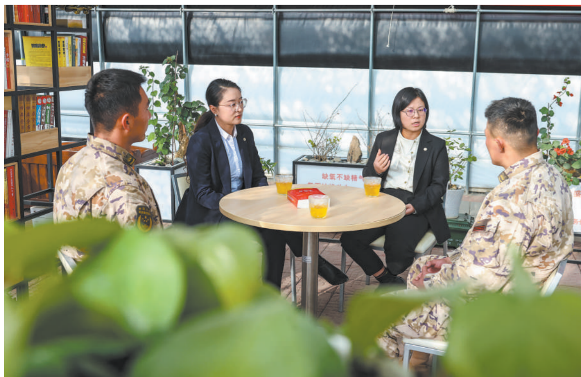
十二月五日，武警新疆总队某支队邀请驻地法律工作者讲解法律知识。