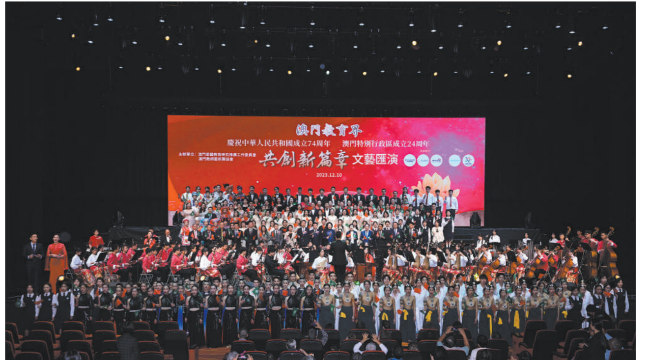
12月10日，来自澳门40余所学校的400多位师生，以歌咏、舞蹈、中西乐器、演讲、舞狮等表演形式，庆祝中华人民共和国成立74周年、澳门特别行政区成立24周年。

为烈士寻找名字和亲人的工作仍在继续。如果您掌握关于五塔寺战斗或六郎庄烈士墓烈士的线索，欢迎拨打北京市海淀区退役军人事务局优抚科电话010-82725531。让我们一起守护烈士忠魂，为无名烈士找回姓名、找到亲人！