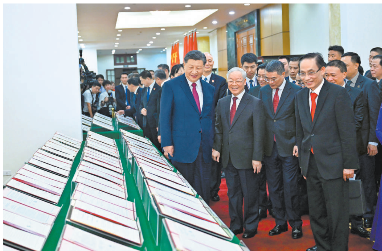
当地时间12月12日下午，刚刚抵达河内的中共中央总书记、国家主席习近平在越共中央驻地同越共中央总书记阮富仲举行会谈。这是会谈后，两党总书记共同见证双方签署的双边合作文件展示。