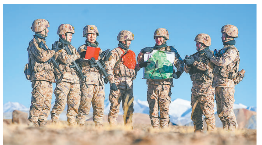
12月5日，新疆军区某团列兵在轻武器精度射击课目中打出满环好成绩，该团为其颁发优秀射手表彰证书以资鼓励。

昆明市委宣传部相关负责人表示，国防教育基地命名只是一个新起点，他们将充分发挥全民国防教育基地的品牌效应和教育功能，以45家市级全民国防教育基地为重要依托，进一步完善教育设施、健全管理制度，有针对性地开展全民国防教育。同时，积极拓展基层阵地，充分发挥新时代文明实践中心等场所作用，推动全民国防教育延伸到城乡基层、覆盖到各类人群。