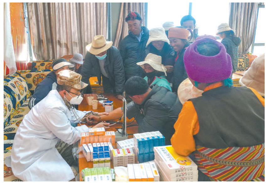
11月27日，西藏军区某团医护人员走进驻地村庄开展义诊活动。

左上图：2019年12月13日，在捐赠仪式现场拍摄的记录日军暴行的37分钟版马吉影像“一寸盘”。