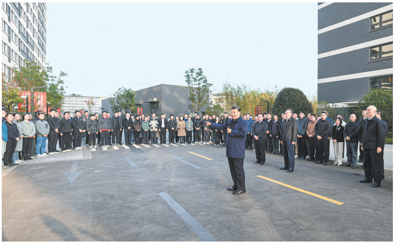
11月28日至12月2日,中共中央总书记、国家主席、中央军委主席习近平在上海考察。这是11月29日下午,习近平在闵行区新时代城市建设者管理者之家,同社区居民亲切交流。

新华社上海/江苏盐城12月3日电 中共中央总书记、国家主席、中央军委主席习近平近日在上海考察时强调,上海要完整、准确、全面贯彻新发展理念,围绕推动高质量发展、构建新发展格局,聚焦建设国际经济中心、金融中心、贸易中心、航运中心、科技创新中心的重要使命,以科技创新为引领,以改革开放为动力,以国家重大战略为牵引,以城市治理现代化为保障,勇于开拓、积极作为,加快建成具有世界影响力的社会主义现代化国际大都市,在推进中国式现代化中充分发挥龙头带动和示范引领作用。