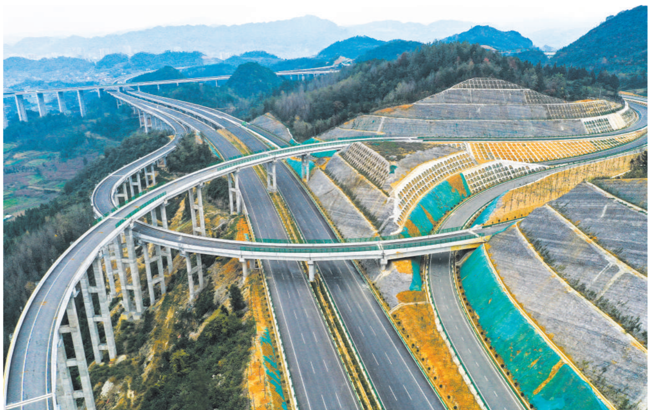
贵阳经金沙至古蔺(黔川界)高速公路(贵金高速)将于11月24日正式通车运营。届时，贵阳至金沙县城通行时间将由原来2小时缩短至1小时左右。图为11月23日拍摄的贵金高速公路杜家山互通(无人机照片)。

根据通报，今年10月全国共查处形式主义、官僚主义问题4131起，批评教育帮助和处理6389人。其中，查处“在履职尽责、服务经济社会发展和生态环境保护方面不担当、不作为、乱作为、假作为，严重影响高质量发展”方面问题最多，查处3660起，批评教育帮助和处理5718人。