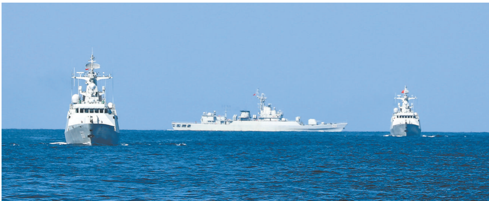
日前,海军某支队组织训练。

考出硝烟味,评出战斗力。前不久,该基地组织首长机关战术作业考核,针对情况研判不准确等问题,考官当场打分、现场点评,并详细登记在册、形成问题清单。他们还健全完善党委统训、支部研训、党员自训机制,研究制定军事训练计划、人才培养计划等,由各党支部负责具体实施,推动部队训练水平稳步提升。