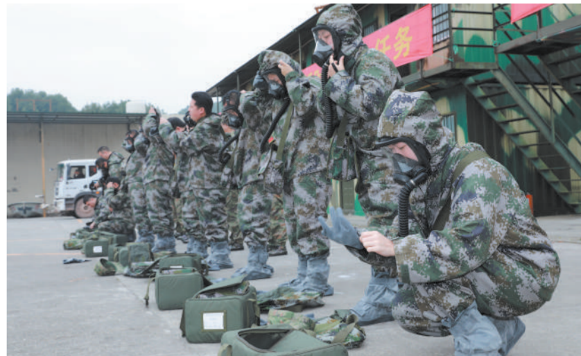
11月10日，重庆市沙坪坝区人武部采取静态检查与动态考评相结合的方式，对民兵应急分队进行考评。图为洗消分队快速穿戴防护装备。 高效文摄