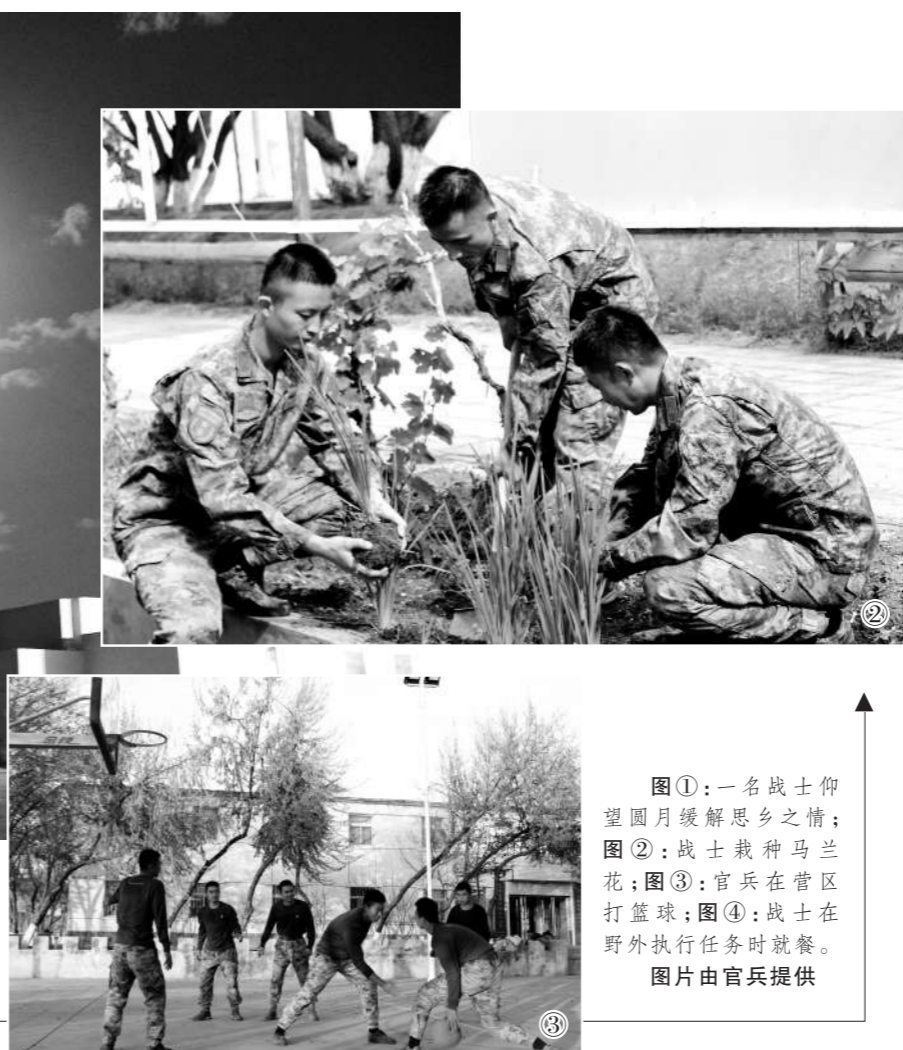
图①：一名战士仰望明月缓解思乡之情；图②：战士栽种马兰花；图③：官兵在管区打篮球；图④：战士在野外执行任务时就餐。