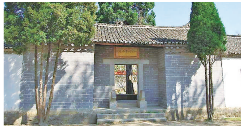
金寨县列宁小学旧址。

1932年秋，红四方面军实行战略转移时，列宁小学的大部分学生参加红军，大部分校舍被国民党军焚毁。1957年，瓦屋基小学和四道河小学合并，迁入六区一乡列宁小学旧址，恢复了列宁小学的校名，称作“金寨县列宁小学”。