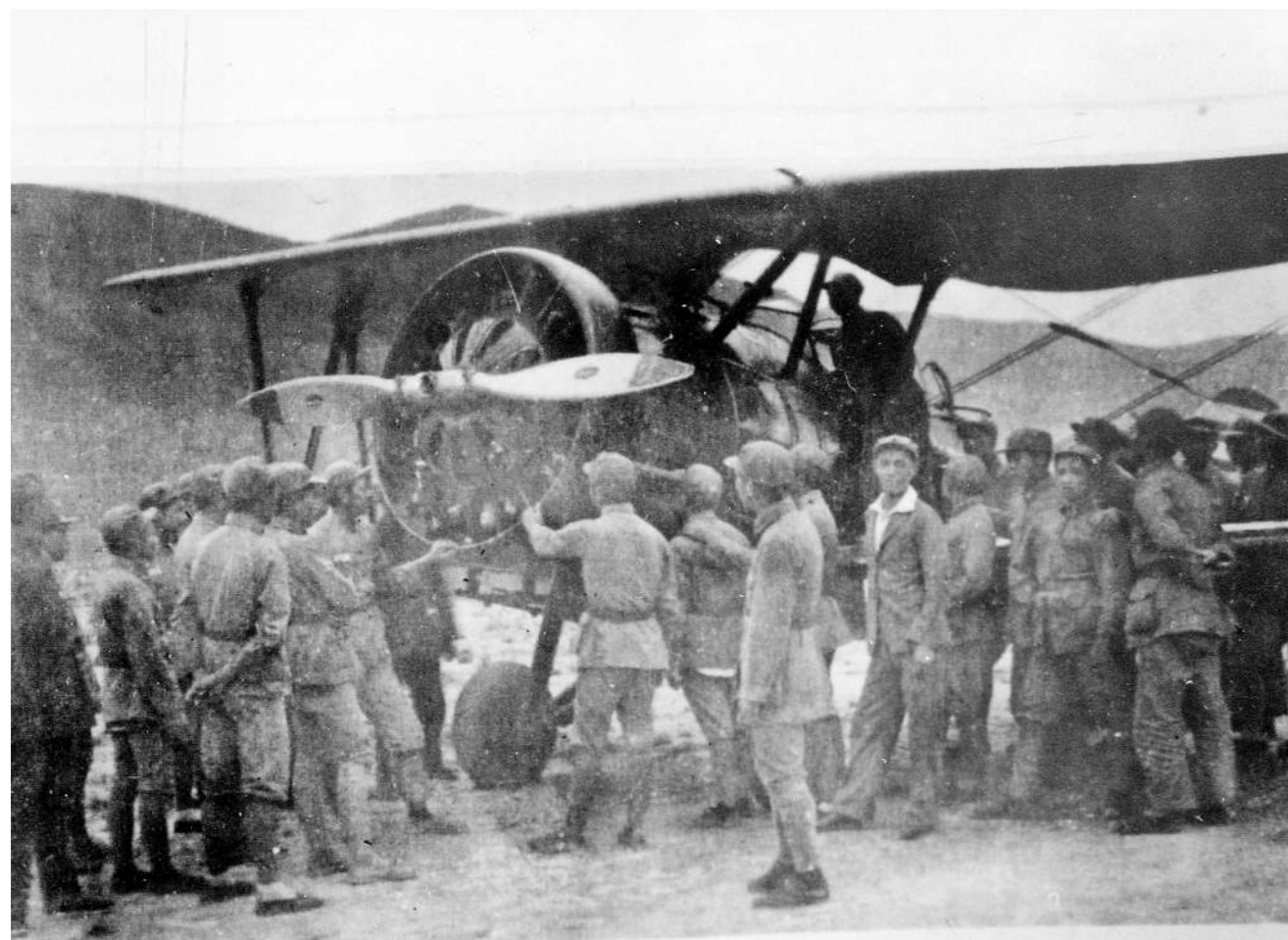
1932年4月，红军攻占漳州后缴获的飞机。

红军时期缴获的两架飞机和建立的航空机构虽然没有保存下来，却反映了我军早期对航空事业的重视。