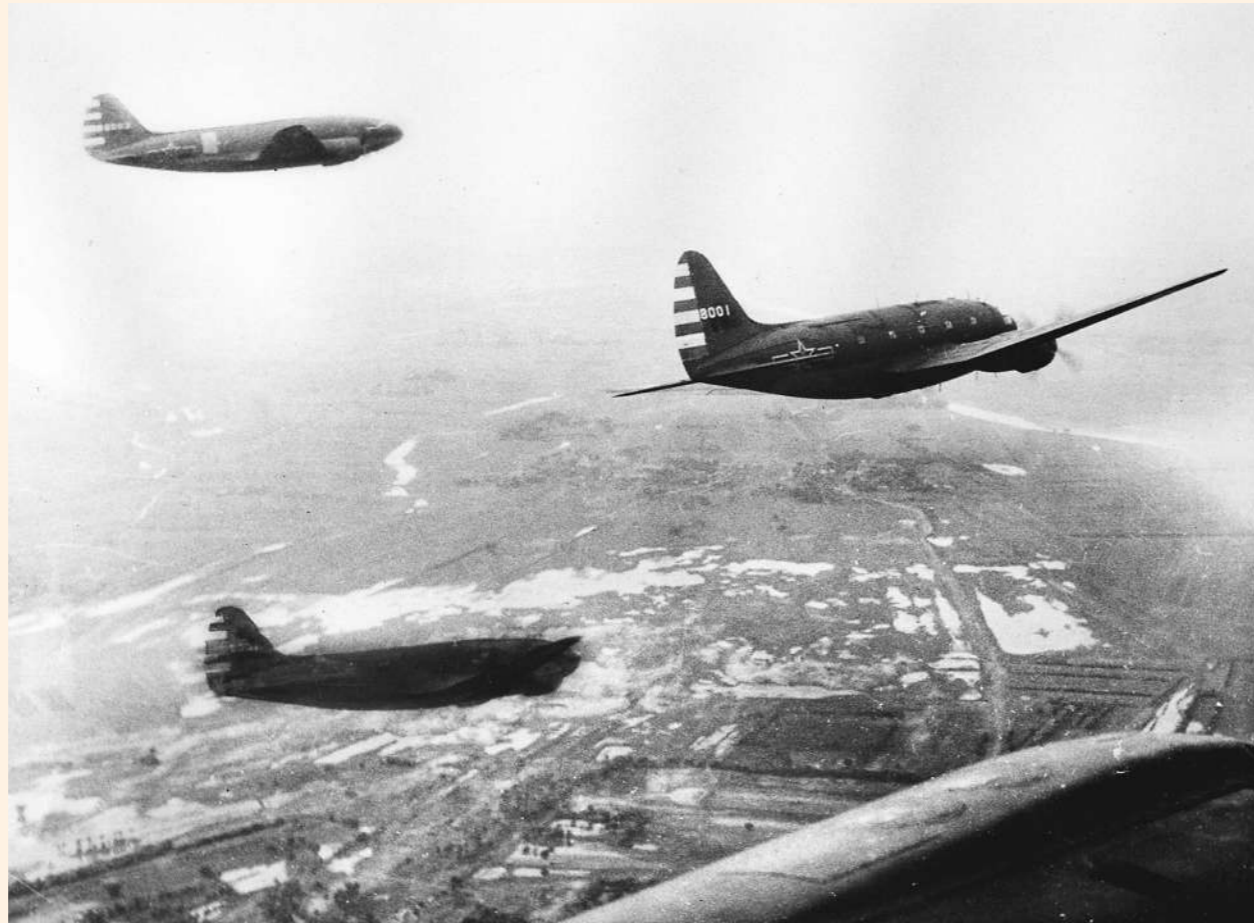
接受检阅的机群通过天安门上空。