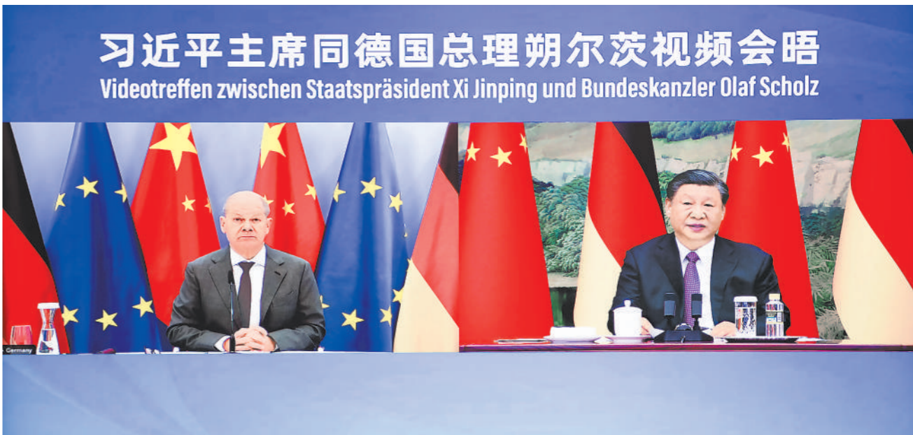
11月3日下午,国家主席习近平同德国总理朔尔茨举行视频会晤。

新华社北京11月3日电 (记者杨依军)11月3日下午,国家主席习近平同德国总理朔尔茨举行视频会晤。