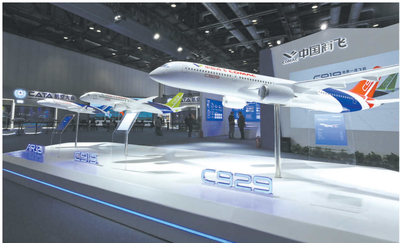
11月3日，首届CATA航空大会在北京举行。CATA航空大会是由中国航空运输协会(CATA)主办的民航领域盛会，旨在加强交流合作，助力民航高质量发展。图为当日在中国商用飞机有限责任公司展台拍摄的国产C929(右)、C919(中)等飞机模型。