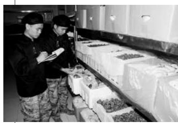
炊事班战士整理多功能菜窖。