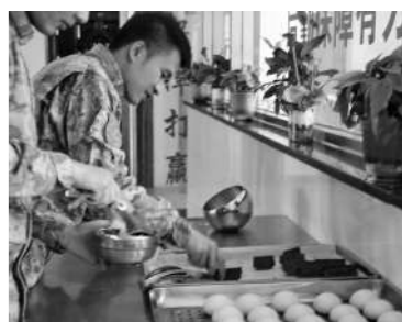
官兵在食堂取食火龙果。

暖心从暖胃开始。下一步,他们还将为任务运输队配备便携保温箱、冷藏柜等设备,携带食材蔬菜,配合炊事车伴随保障,让官兵在高原运输任务途中吃上热饭热菜。