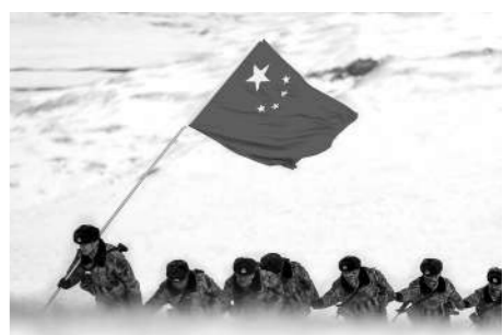
连队官兵在风雪中巡逻。