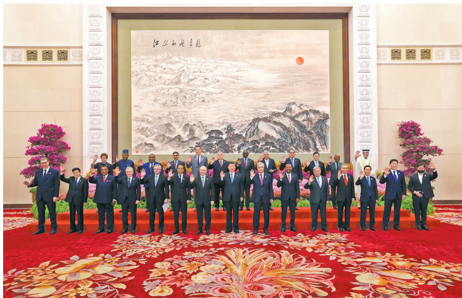
10月18日上午,国家主席习近平在北京人民大会堂出席第三届“一带一路”国际合作高峰论坛开幕式并发表题为《建设开放包容、互联互通、共同发展的世界》的主旨演讲。