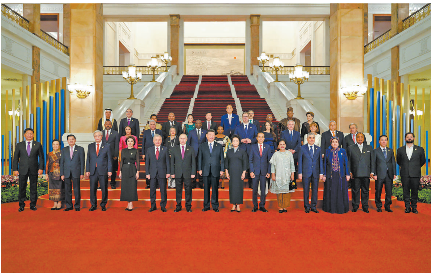
10月17日晚,国家主席习近平和夫人彭丽媛在北京人民大会堂举行宴会,欢迎来华出席第三届“一带一路”国际合作高峰论坛的国际贵宾。这是习近平发表致辞,代表中国政府和中国人民对各位嘉宾出席第三届“一带一路”国际合作高峰论坛表示热烈欢迎。