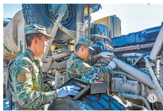
图①：车队通过高原天路。 图②：训练间隙，连队开展趣味活动。 图③：官兵对车辆进行日常检修。