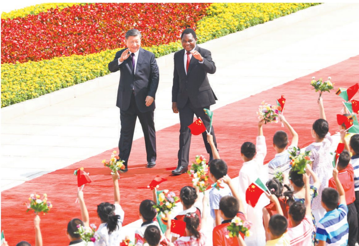
九月十五日上午,国家主席习近平在北京人民大会堂同来华进行国事访问的赞比亚总统希奇莱马举行会谈。这是会谈前,习近平在人民大会堂东门外广场为希奇莱马举行欢迎仪式。

新华社北京9月15日电 (记者郑明达)9月15日上午,国家主席习近平在人民大会堂同来华进行国事访问的赞比亚总统希奇莱马举行会谈。两国元首宣布,将中赞关系提升为全面战略合作伙伴关系。 习近平指出,中赞传统友谊由两国老一辈领导人亲手缔造,历经国际风云变幻的考验。坦赞铁路是中非友好的象征,两国人民彼此怀有特殊友好情谊。中方始终从战略高度和长远角度看待和发展中赞关系,愿同赞方一道努力,将两国深厚的传统友谊转化为新时代合作共赢的不竭动力,推动中赞关系行稳致远,不断迈上新台阶。 习近平强调,中国支持赞比亚维护国家主权、安全、发展利益,探索符合本国实际的发展道路,愿同赞方加强党际交往和治国理政经验交流,在涉及彼此核心利益和重大关切问题上坚定相互支持。中国现代化的成功展现了世界现代化模式的多样性,中国高质量发展和现代化进程将继续为包括赞比亚在内的世界各国带来新机遇。中方愿同赞方一道,以共建“一带一路”为引领,拓展基础设施建设、农业、矿业、清洁能源等领域合作,共同实现发展振兴。中方鼓励更多赞比亚优质产品进入中国市场,支持更多中资企业赴赞比亚投资兴业。双方要办好明年两国建交60周年庆祝活动,