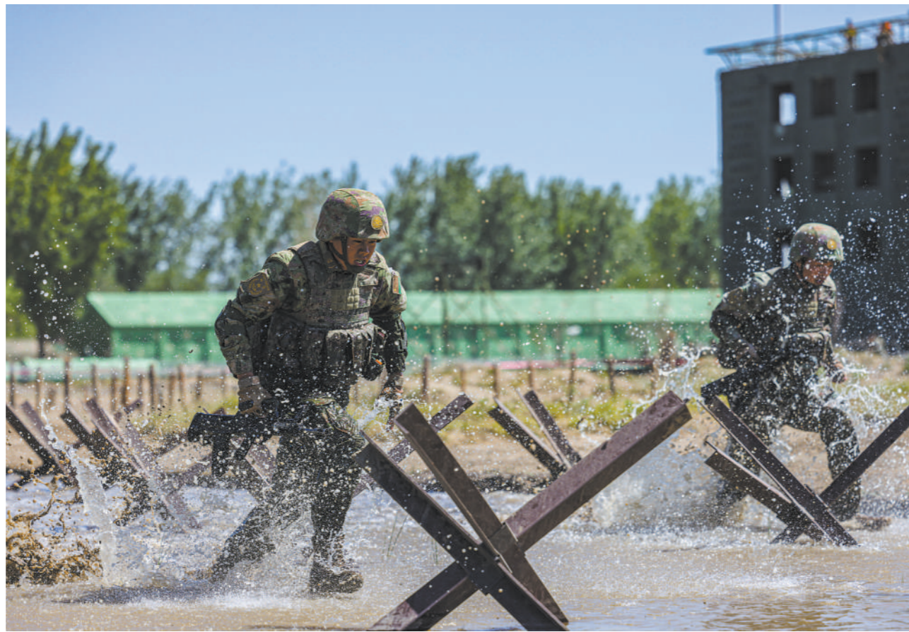
“松骨峰特功连”组织单兵战术综合演练。