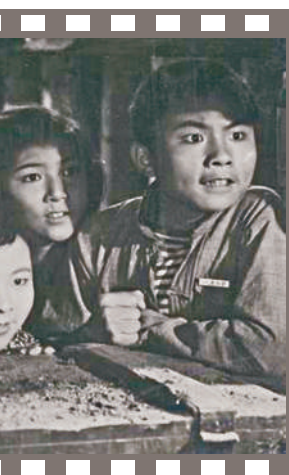
电影《英雄小八路》剧照。

影片中“英雄小八路”的原型，是1958年炮击金门战斗中，位于厦门前线的禾山第四中心小学（今何厝小学）的学