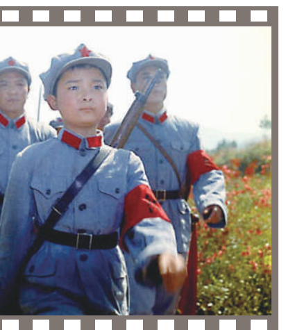
电影《闪闪的红星》剧照。

随着电影《英雄小八路》的公映，旋律高亢、充满革命激情的主题曲《我们是共产主义接班人》唱响祖国大地，深受广