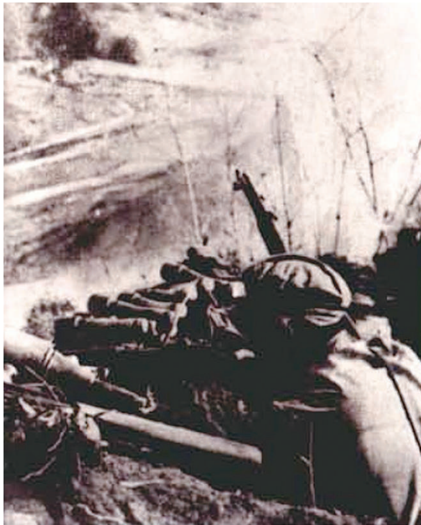
在华川一带进行防御的志愿军。

针对敌情、我情和地形特点，第58师制订出依托山地的阶梯型防御部署计划。第一梯队是第173团和第174团，分别扼守华川以北的山地和纵贯南北的主要道路。其中，第173团仅在